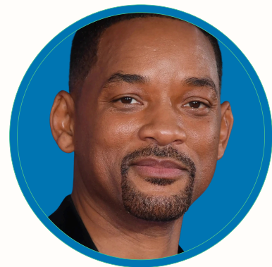
Will Smith Actor, cantant i productor