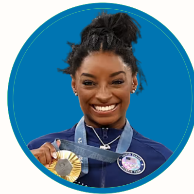
Simone Biles Gimnasta Olímpica