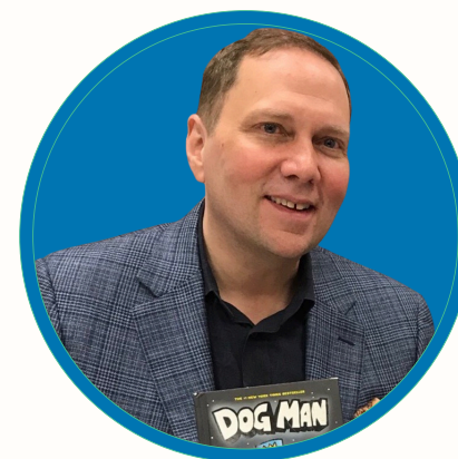
Dav Pilkey Escriptor