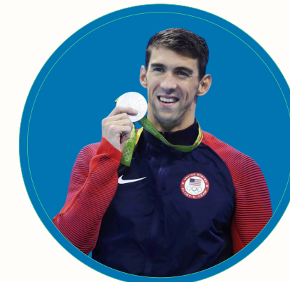
Michael Phelps Nadador olímpic