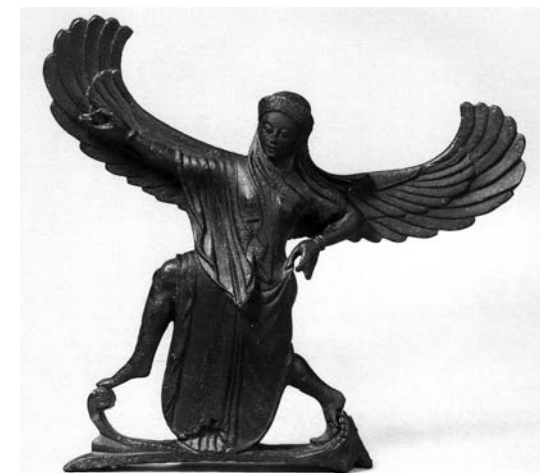
Nike. Segle VI a.C.