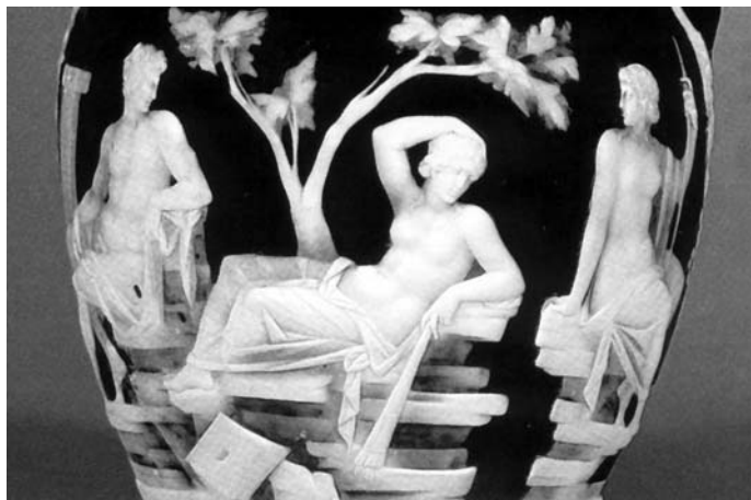
Vas Portland. Segle I