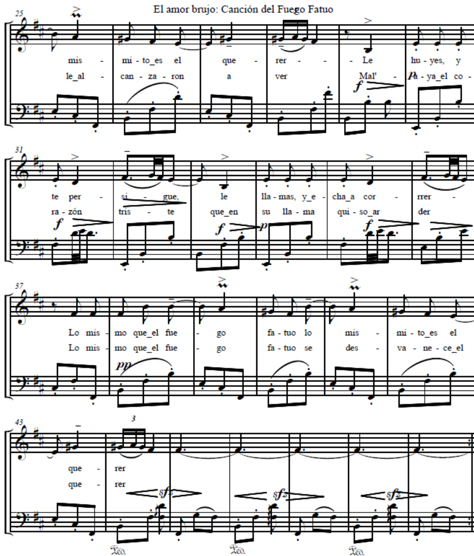
Manuel de Falla. El amor brujo . "Canción del fuego fatuo"