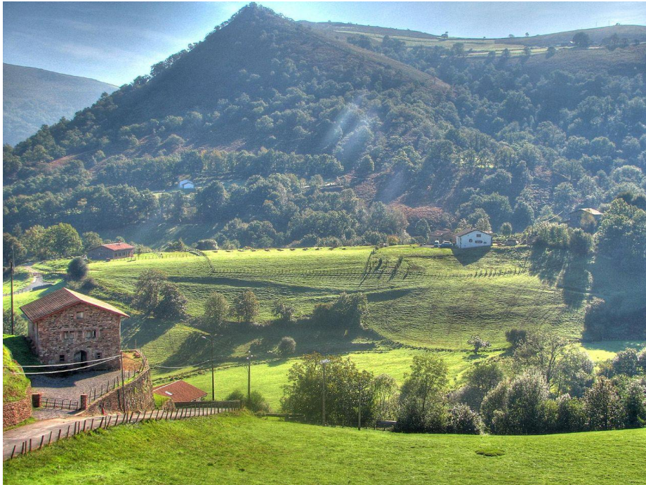
Imagen 1: Fuente: Wikipedia. De Michael Clarke Stuff - Bidarray

Según las siguientes imágenes responde a las preguntas que, a continuación, se formulan: