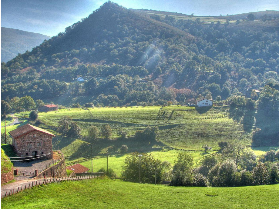
Imagen 1: Fuente: Wikipedia. De Michael Clarke Stuff - Bidarray

Según las siguientes imágenes responde a las preguntas que, a continuación, se formulan: