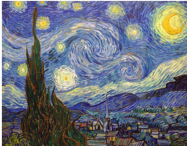
2 (CC BY-SA 3.0)