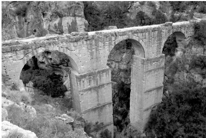
Aqüeducte de Peña Tallada -Calles-