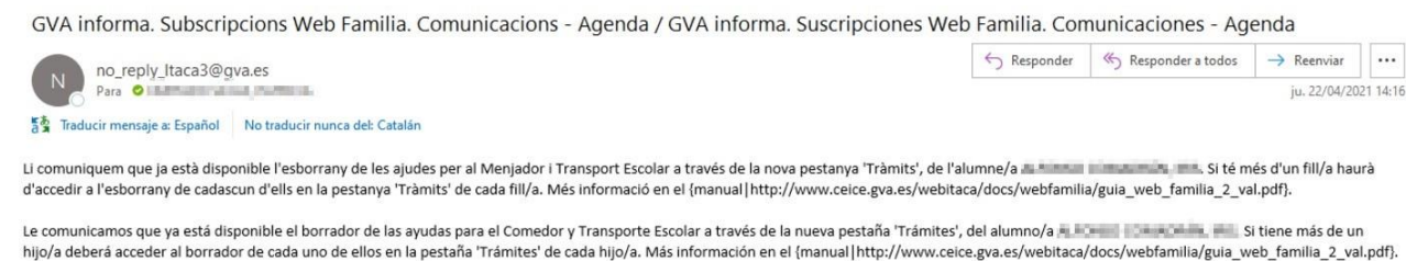
Figura 2: Correu de notificació d'esborranys d'Ajudes de Menjador i Transport

Si s'ha subscrit, rebrà un correu de l'estil al qual s'indica en la següent imatge: