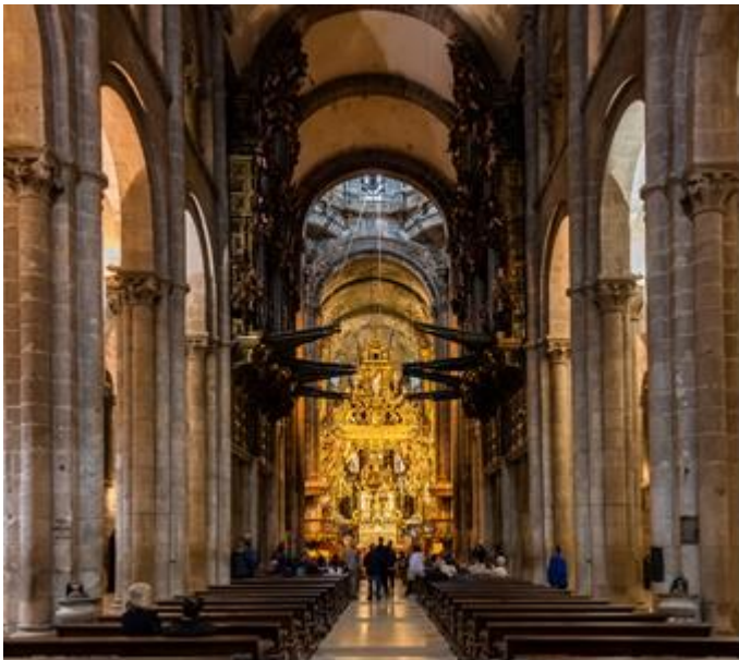
Imagen 2: Catedral de Santiago de Compostela (interior). S. XII. Imatge 2: Catedral de Santiago de Compostela (interior). S. XII.