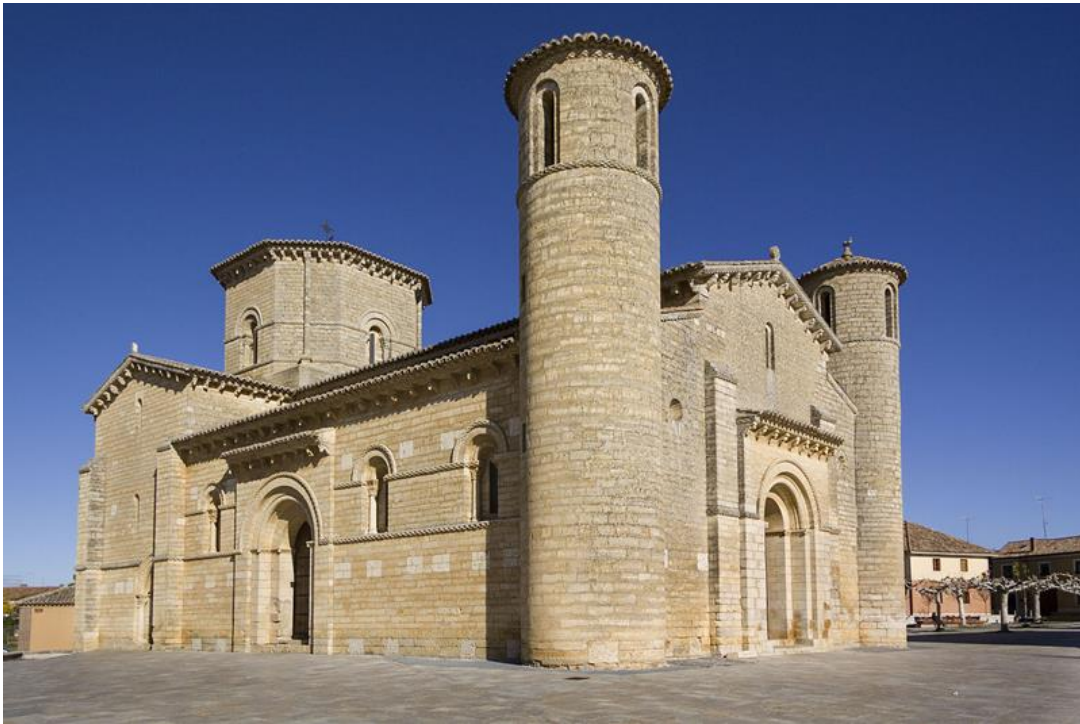
Imagen 1: Iglesia de San Martín de Frómista. S. XI. Imatge 1: Església de Sant Martí de Frómista. S. XI.