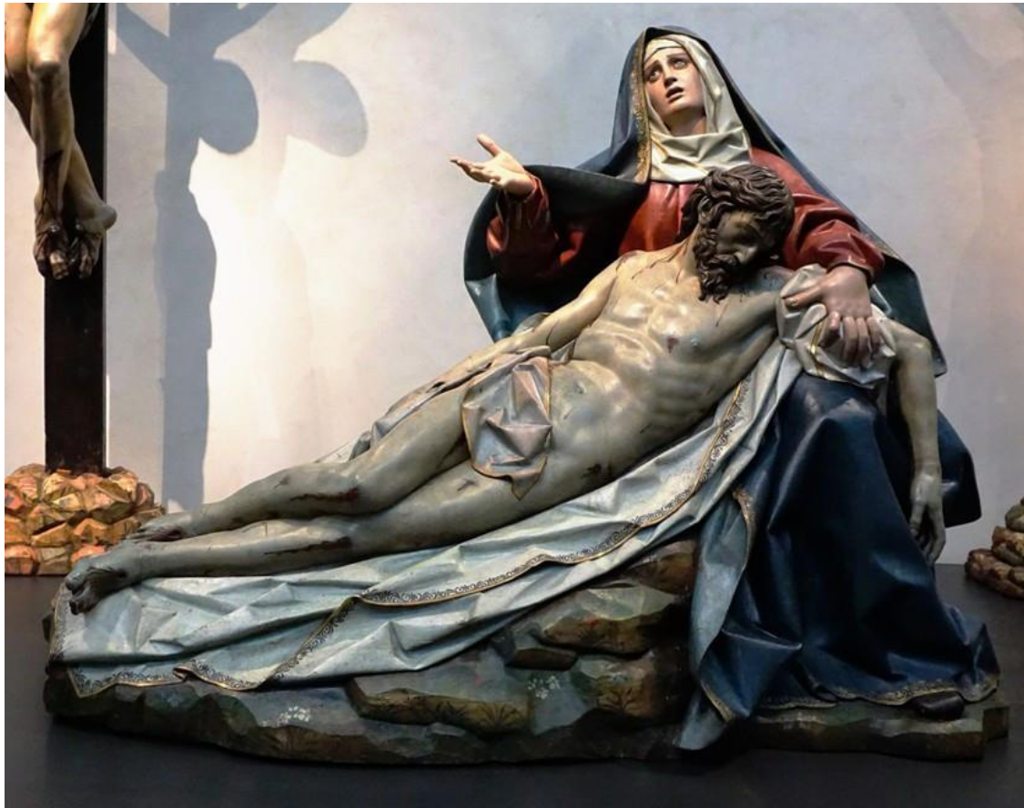
Imagen 4: Gregorio Fernández. 1616. Piedad . Imatge 4: Gregorio Fernández. 1616. Pietat .