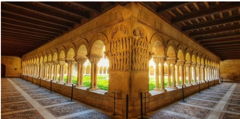
Imagen 3: Monasterio de Santo Domingo de Silos. Claustro. S. XI-XII. Imatge 3: Monestir de Santo Domingo de Silos. Claustre. S. XI-XII.