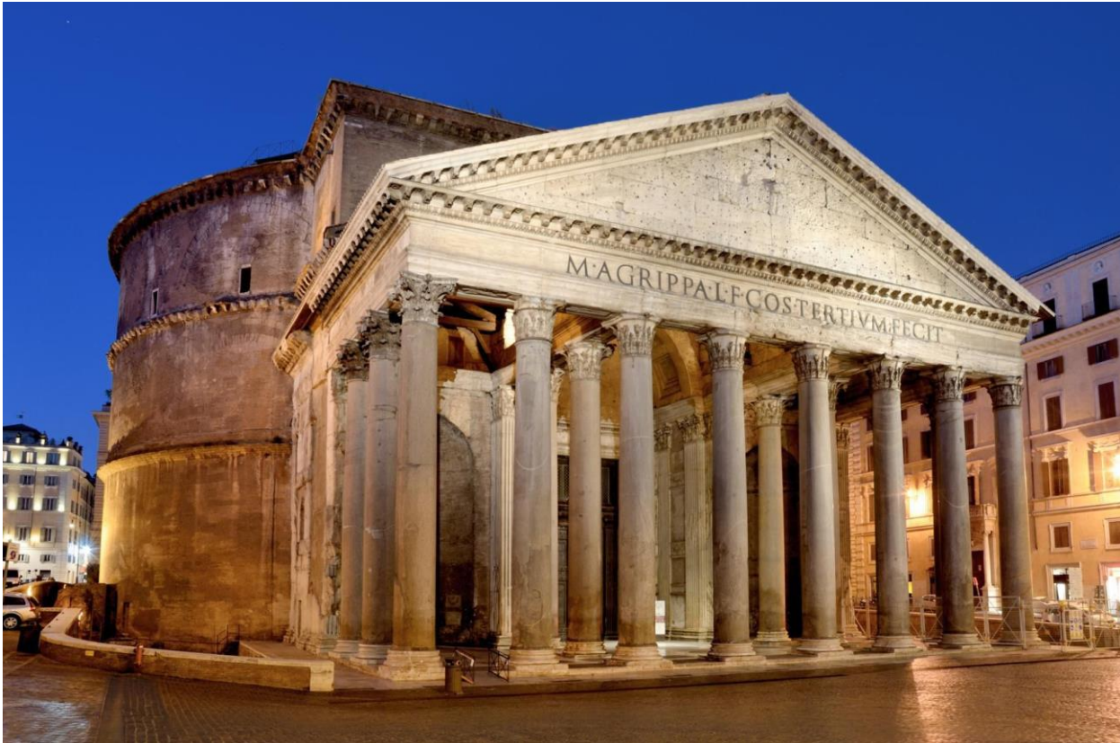
Imatge 1. Panteó, Roma Imagen 1: Panteón, Roma. S. II d. C.