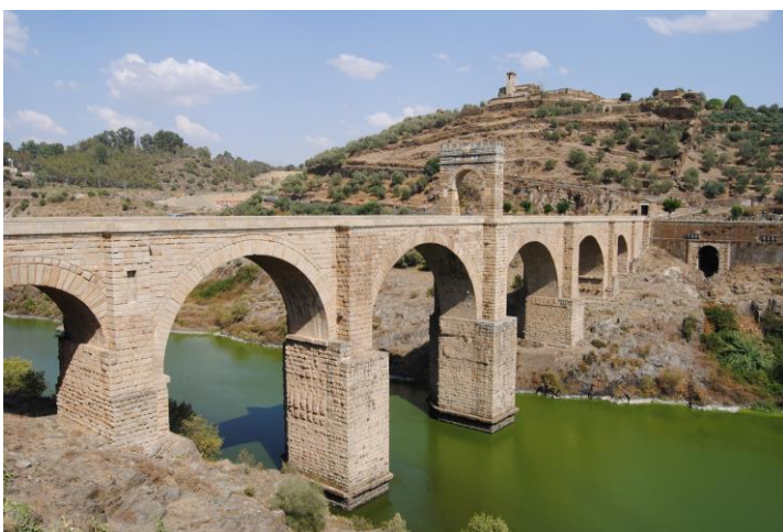
Imatge 2. Pont d'Alcántara, Càceres. Imagen 2: Puente de Alcántara, Cáceres. S. II d. C.