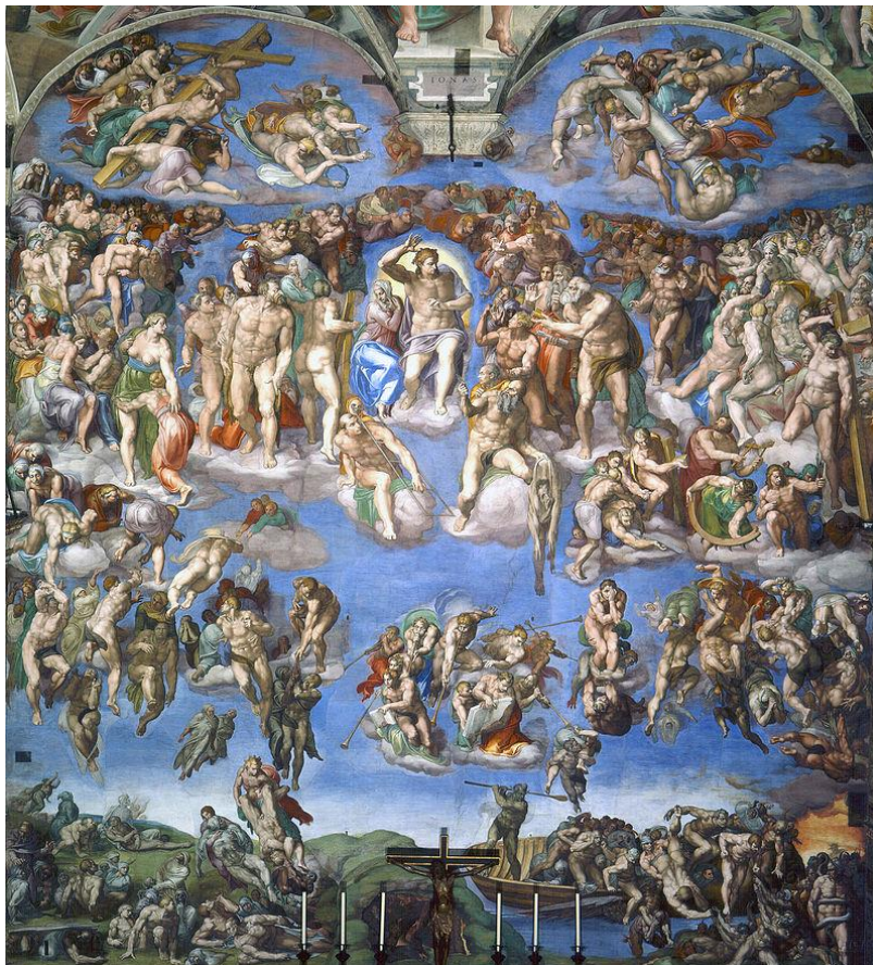
Imatge 5. Miquel Àngel. El judici final . Capella Sixtina (Roma, Vaticà), 1537-1541 Imagen 5: Miguel Ángel. El Juicio Final . Capilla Sixtina (Roma, Vaticano), 1537-1541