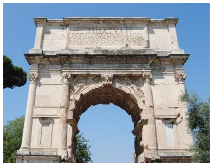
Imatge 3: Arc de Tit, Roma. Imagen 3: Arco de Tito, Roma. S. I d. C.