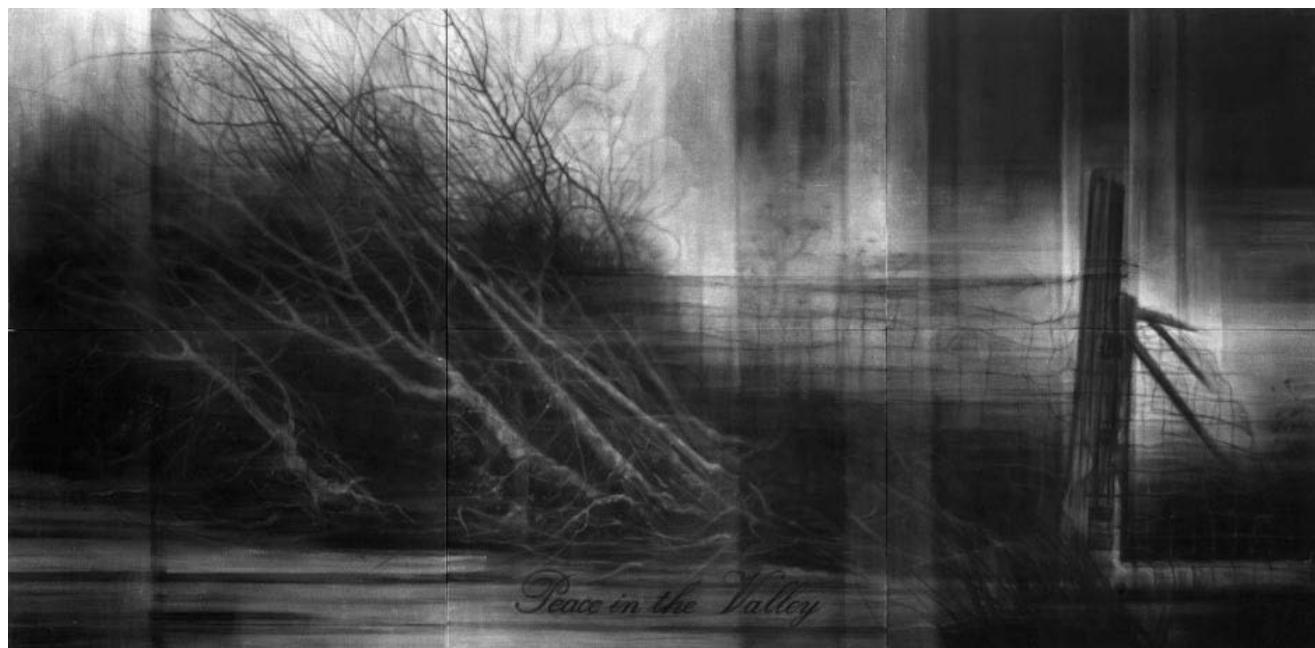
Chema López: There will be? Acrílic sobre llenç, 210 x 432 cm, 2014. Col·lecció de l'artista

Interpreta esta obra o un fragmento de ella mediante la técnica mixta y el uso del color. El soporte debe tener un tamaño DIN A4 y adecuarse a la técnica.