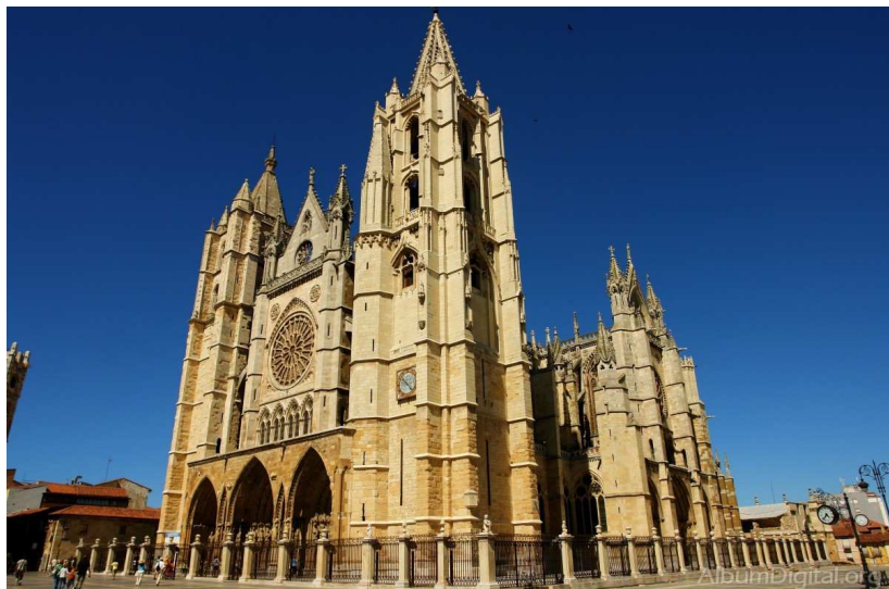
Imagen 1: Catedral de León, exterior. Siglo XIII. Su inicio se ha situado tradicionalmente después de 1255.

Imatge 1: Catedral de León, exterior. Segle XIII. El seu inici s'ha situat tradicionalment després de 1255.