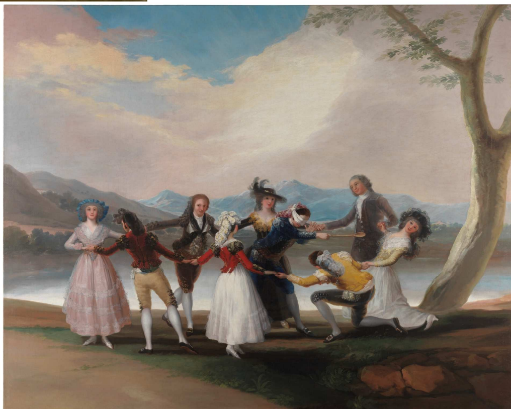
Imagen 2: Francisco de Goya. La gallina ciega , Museo Nacional del Prado, Madrid, 1788.

Imatge 2: Francisco de Goya. La gallina cega , Museo Nacional del Prado, Madrid, 1788