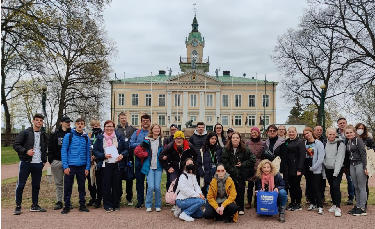
Foto grupal durant l'intercanvi a Pori (Finlàndia) el maig de 2022