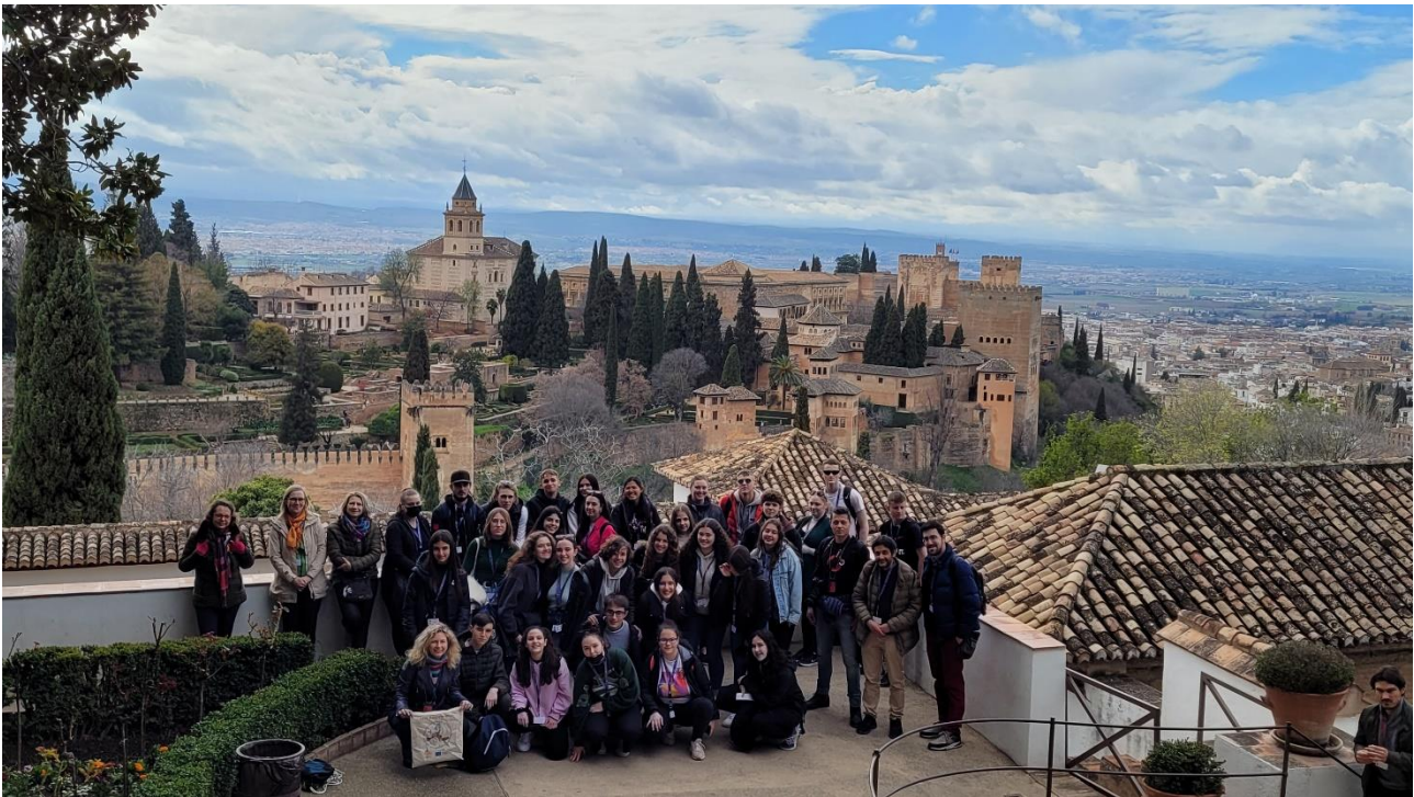
Visita a l'Alhambra durant l'intercanvi a Espanya al març 2022

https://portal.edu.gva.es/iesgabrielmiro/erasmus/projecto-k2/2020-1-hu01-ka229-078749_3/