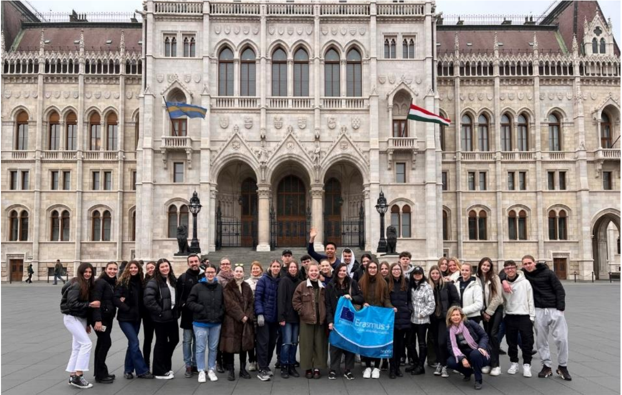
Foto grupal durant l'intercanvi a Hongria al març 2023