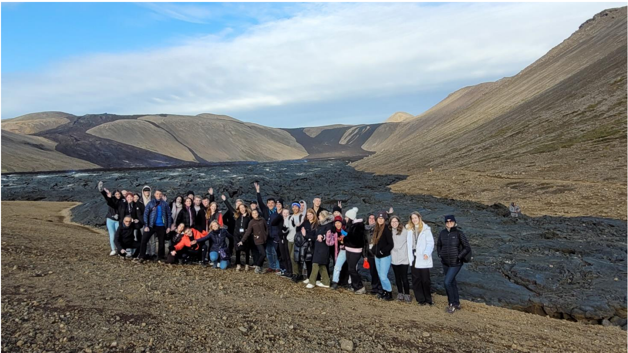
Foto grupal durant l'intercanvi a Islàndia el setembre de 2022