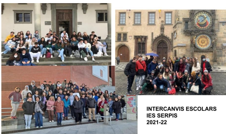
INTERCANVIS ESCOLARS IES SERPIS 2021-22

vinculación específica con algunos de los principios básicos del Programa Erasmus y con objetivos generales del PLAN ERASMUS del centro.