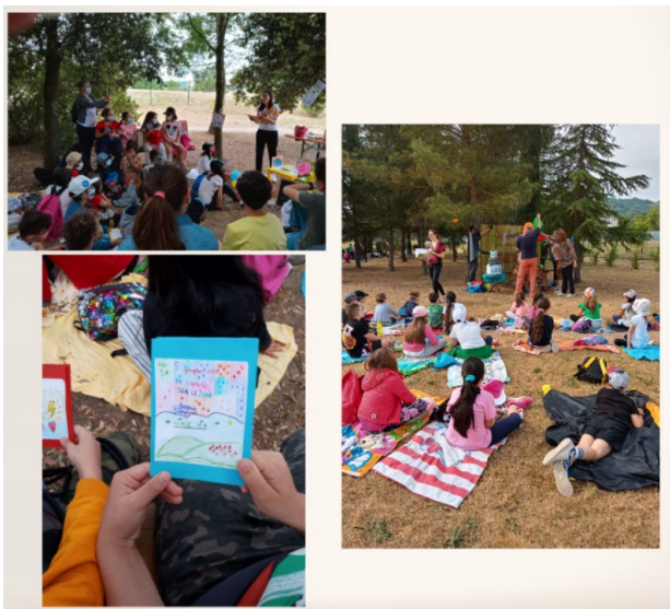
Festival Reading en Torgiano-Bettona.

El proyecto S.I.L.K. está cofinanciado por el programa Erasmus+ de la Unión Europea. El contenido de este artículo es responsabilidad exclusiva de la SES Joan Fuster de Sollana. Ni la Comisión Europea ni el Servicio Español para la Internacionalización de la Educación (SEPIE) son responsables del uso que pueda hacerse de la información aquí difundida.