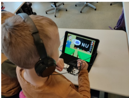
Alumno de 6 años aprendiendo con una tableta