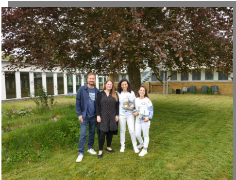
Con los maestros del Nordre Skole Fortuna (Dinamarca)

La acogida de las maestras por parte del colegio fue fabulosa y se pudieron integrar plenamente en el desarrollo de la actividad escolar en este colegio de Dinamarca. Además, este contacto va a permitir que maestros y alumnos de este colegio danés viajen en el próximo mes de octubre a Torrevieja y puedan compartir una experiencia tan enriquecedora con los alumnos.