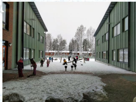
ALUMNAT JUGANT EN LA NEU