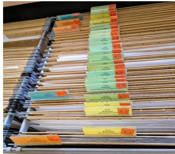
el cofre del tresor de les fitxes dividides per nivells i destreses