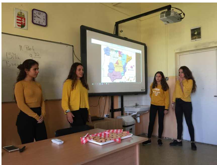
Exposició de les alumnes espanyoles sobre les minories ètniques durant el meeting d'Hongria