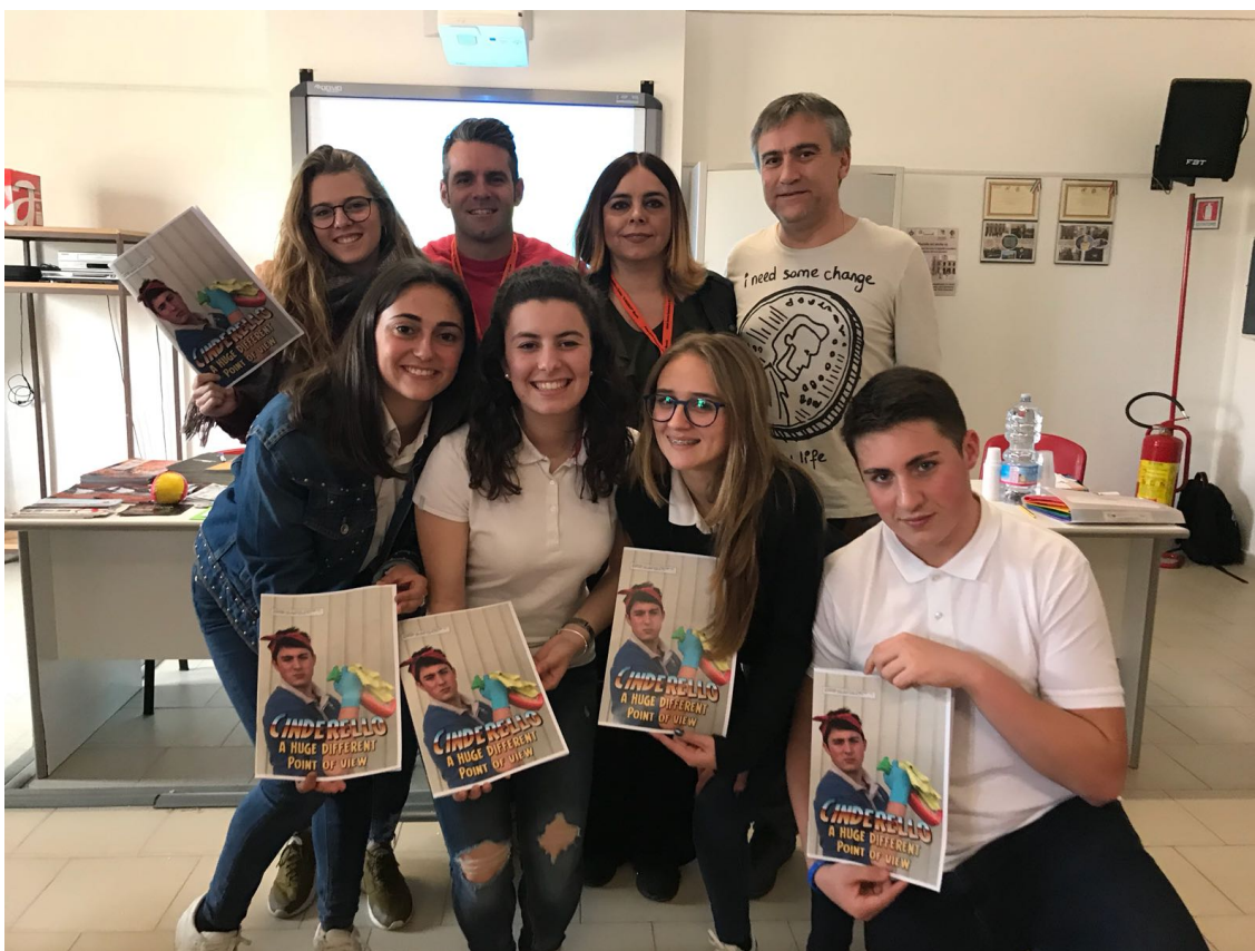
Presentació del còmic Cinderello al Liceo Tecnico Garibaldi a Marsala

En definitiva, “Stick Together” ha sigut per a tota la comunitat educativa de l'IES Monastil d'Elda un projecte molt complet i enriquidor, que ens ha ajudat a madurar i a créixer com a persones, alhora que ens ha permés viatjar, conèixer altres cultures, practicar llengües i, sobretot, prendre consciència de molts problemes de discriminació presents en la nostra societat, per tal que tots plegats hi puguem trobar solucions.