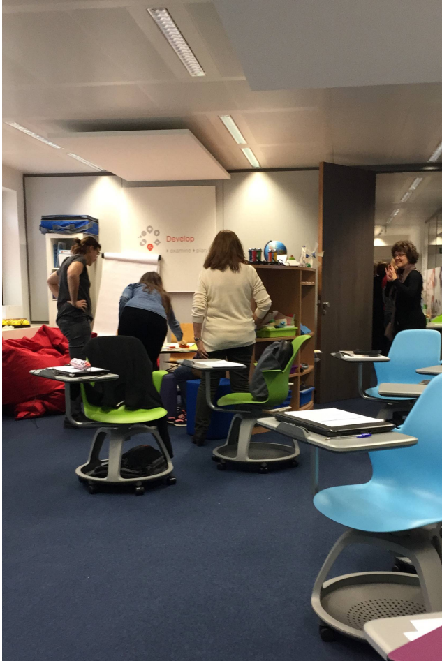
Foto 4 Vam guanyar amb 70 cm de torre d'espaguetis

https://store.steelcase.com/seating/all?brand=221&id=270&price=-1000