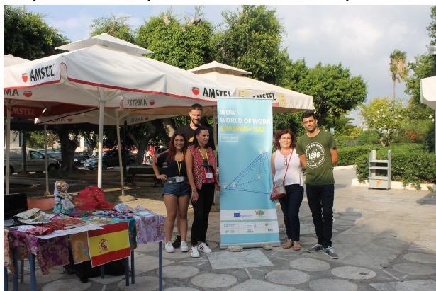
Estand de la seda, presentació dels alumnes de l'IES Benlliure