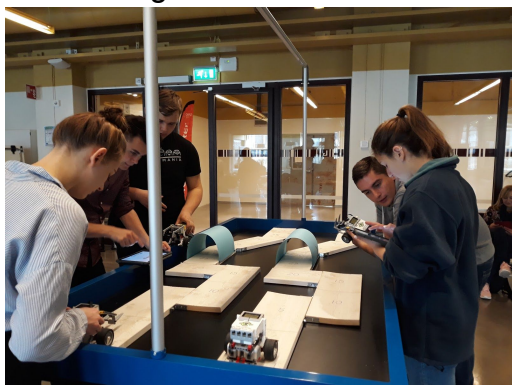
Visita al Centre Tècnic de Värnamo.