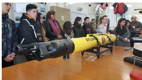
Laboratori a la Universitat de Porto