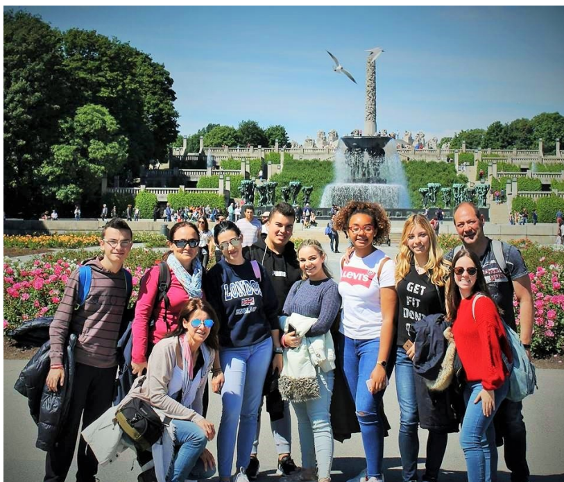
Els alumnes i professors del Projecte ANEN-e+ durant la seua visita a Noruega

L'APP és un dels resultats finals del projecte, és gratuïta i es pot descarregar des de ja a Google Market (només versió Android, buscant: ANEN e+ ). S'hi pot trobar informació útil sobre la història de l'illa, la localització, com anar, què veure, on menjar i quines activitats realitzar; així com d'altres tres parc naturals de Noruega, França i Lituània. Tot el contingut de l'APP ha sigut elaborat pels alumnes, així com els de la pàgina web del programa ANEN, el diccionari en quatre idiomes (francés, lituà, noruec i castellà) i un "Diary trip" on recollir records i sensacions del viatge.