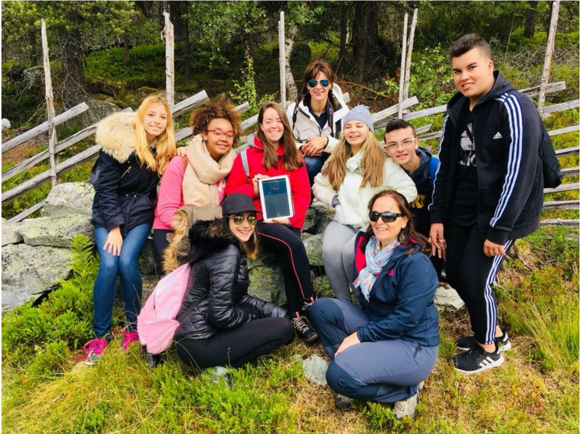
Alumnes i professors en el parc Natural de Gutulia presentant l'APP