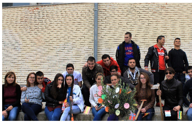
Alumnes de l'ESO i FPQB de Fusta i foto final del grup