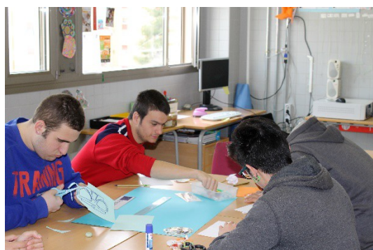
FPQB de Fusta durant l'exposició i treballant a l'aula

Una vegada escollit l'arbre, vam eixir al pati i els alumnes del grup el van plantar amb l'ajuda d'altres alumnes del projecte. Va ser fantàstic veure com cooperaven i disfrutaven els alumnes de FPB i la resta d'alumnes d'ESO treballant junts.