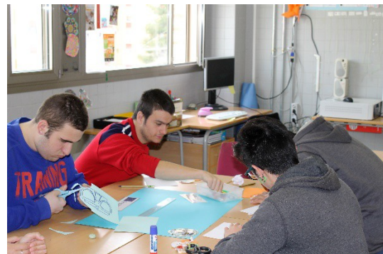
PFCB de la Madera durante la exposición sobre la Unión Europea y los programas ERASMUS+ y trabajando en el aula

A continuación, salimos al patio a plantar el árbol (un olivo) que simbolizará el desarrollo de estos tres años de programa. Fueron los propios alumnos los hicieron todo el trabajo: primero, lo adornaron con etiquetas con los valores que queríamos transmitir; en segundo lugar, cavaron el hoyo y, por último, plantaron el árbol. Todos lo pasamos muy bien realizando esta actividad. Fue una verdadera delicia ver cooperar y disfrutar a los alumnos de la E.S.O. con los alumnos del PFCB de la Madera.