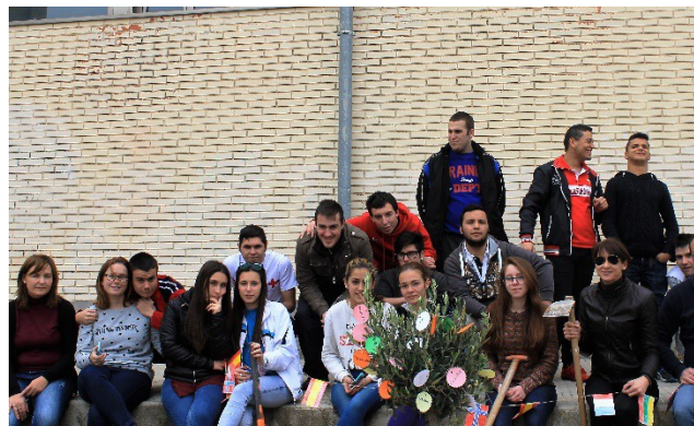
Alumnos de la ESO y de la Madera poniendo las etiquetas y foto final de todo el grupo