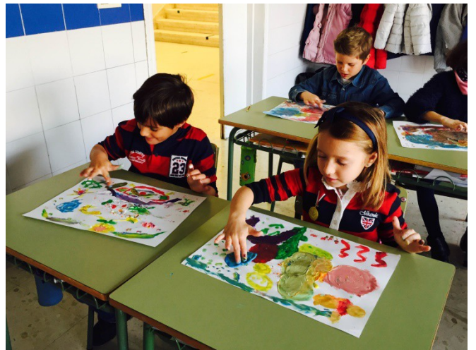
Alumnes realitzant diferents activitats en el marc del Projecte.