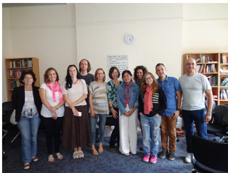
Participants en el curs sobre metodologia CLIL a Londres, Regne Unit.