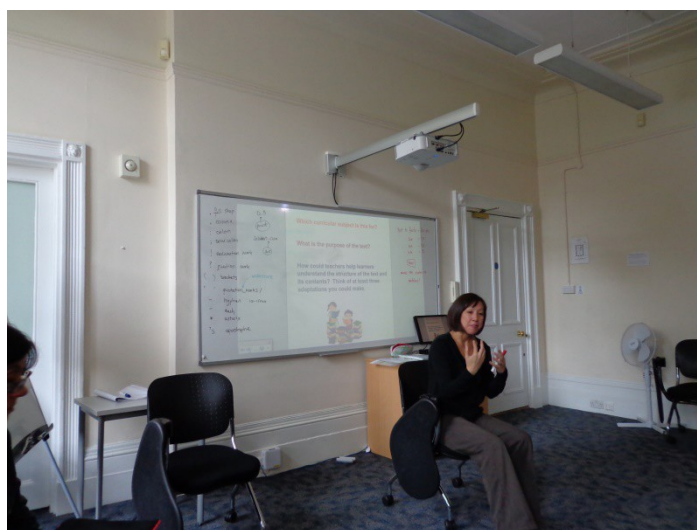
Professora del curs impartint classe.