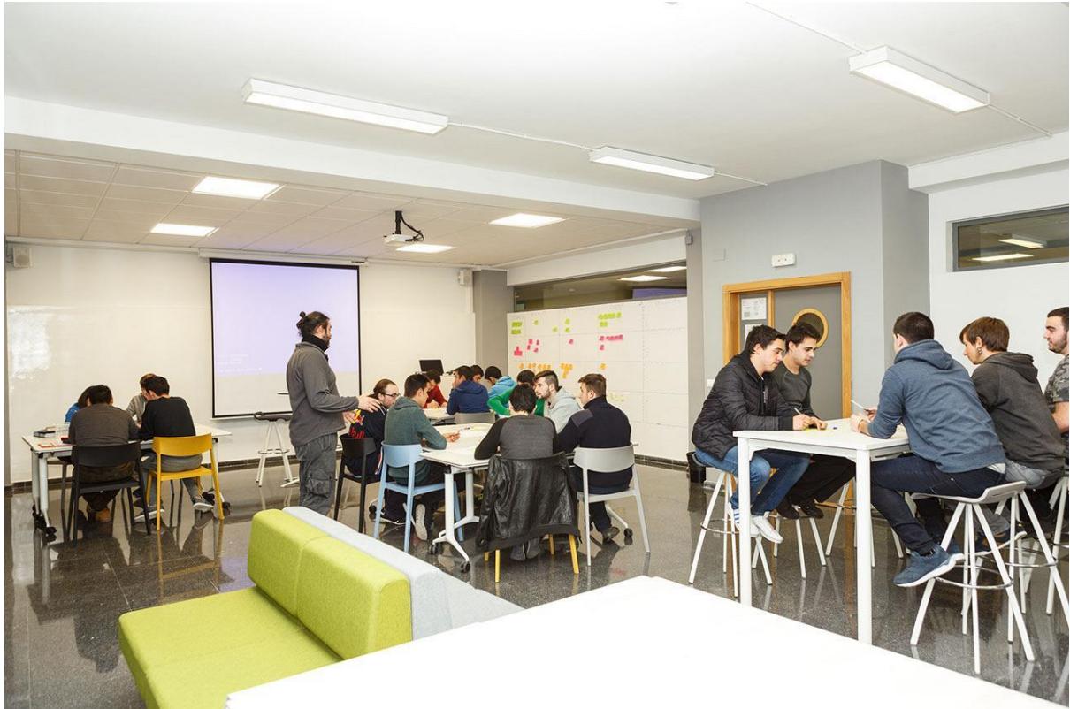
Aula del IES Cotes Baixes (Alcoy)