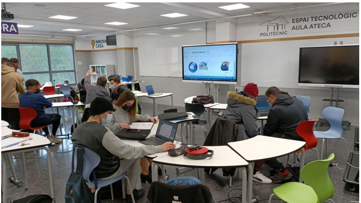
Aula del IES Politecnico (Castellón)