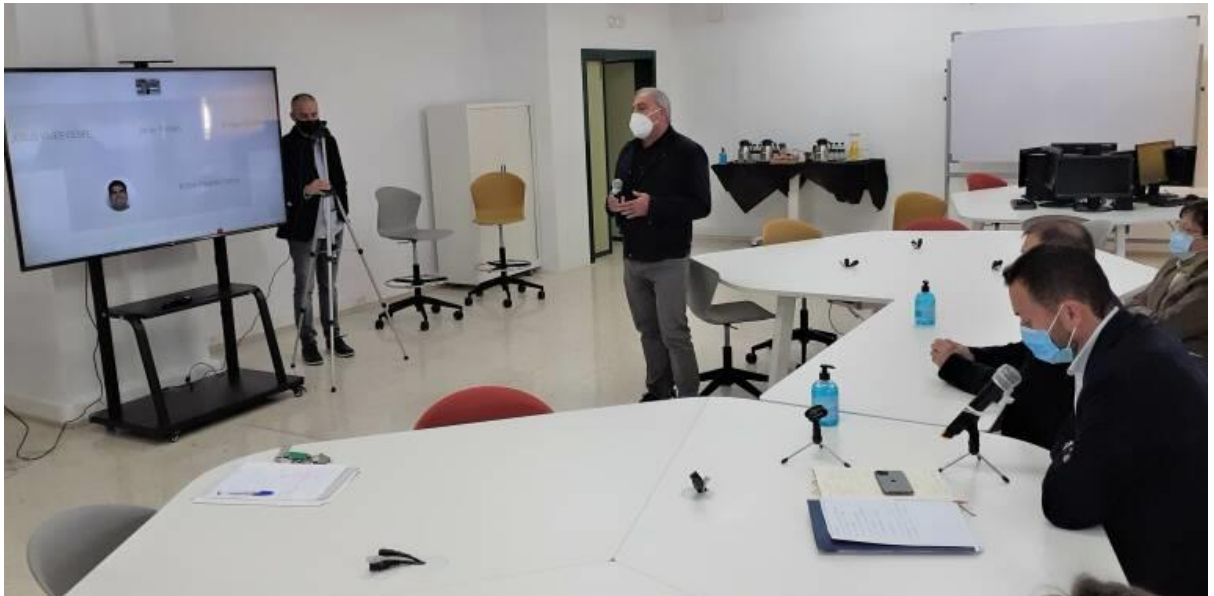
Aula del IES Severo Ochoa (Elche)

A continuación, mostramos ejemplos de buenas prácticas de centros de la Comunidad Valenciana: