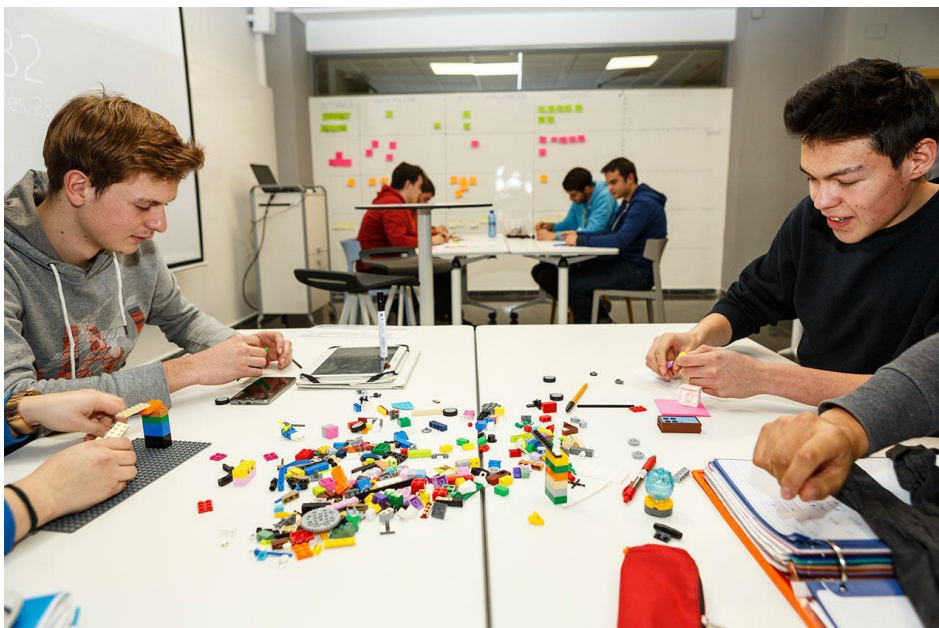
Aula del IES Cotes Baixes (Alcoy)