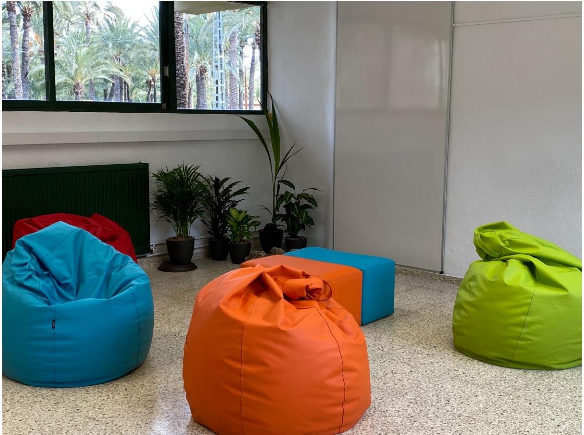
Aula IES La Torre (Elche)