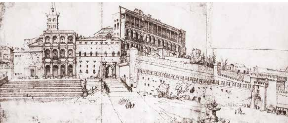
[Segle XVI] Maerten van Heemskerck (1498-1574). Gravat de Sant Pere i el Palau Vaticà. Viena, Graphische Sammlung Albertina.

El 25 de juliol de 1492 mor el papa Innocenci VIII, sent proclamat papa Roderic Borja l'11 d'agost, sota el nom d'Alexandre VI. Uns dies després, el dia 3 d'agost de 1492 van partir del port de Moguer les tres caravel·les que, al comandament de Cristófol Colom, van descobrir el Nou món, tornant al març de 1493 amb notícies dels seus descobriments. Per això una de les primeres qüestions que va abordar Alexandre VI va ser el repartiment de les terres del Nou món entre Castella i Portugal, publicant tres butles per eixe motiu i firmant posteriorment el Tractat de Tordesillas, que fixava el meridià divisor de la zona d'influència portuguesa i castellana a cent llegües de les Açores i Cap Verd.