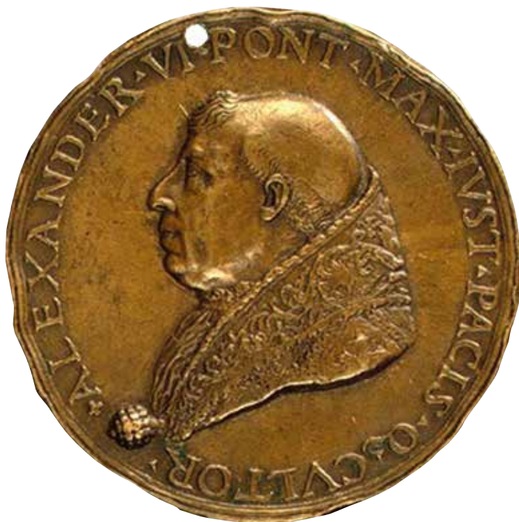
Medalla d'Alexandre VI.

No obstant això va romandre aparentment neutral respecte al regne de Nàpols, ja que el dit territori era reclamat per les corones espanyola i francesa, per la qual cosa va jugar amb les aspiracions d'ambdós corones d'acord amb els seus interessos.