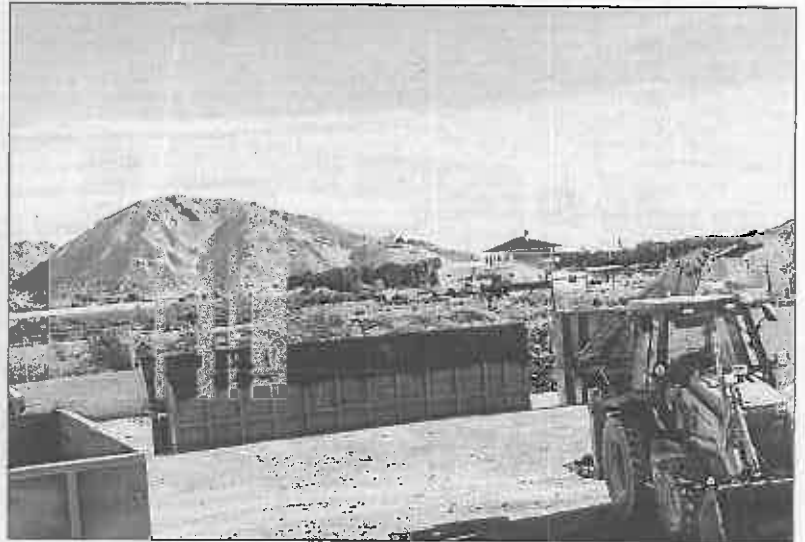
Imagen de la planta de transferencia tomada el pasado mes de marzo.