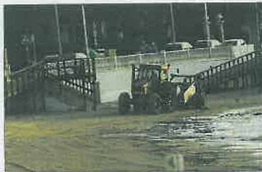
La limpieza de playas, incluida en la prestación.