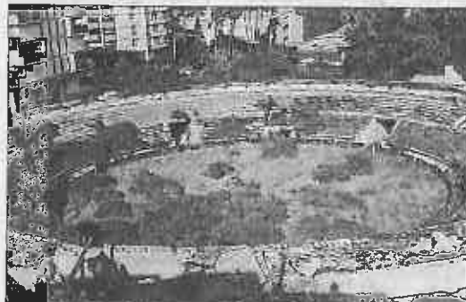
Imagen de la Plaza de Toros, en estado de ruina.

Desde la peña taurina contradicen las pretensiones de la plataforma ciudadana que propone su derribo y la recuperación del jardín de la parte sur de la plaza, ahora cerrado, ya que su pretensión pasa por «acometer un nuevo proyecto o rectificar los que habían, con nuevos baremos económicos, para llevar a cabo la construcción de una nueva plaza