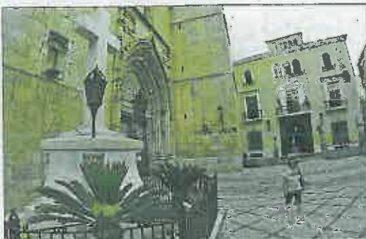
Una imagen de la Cruz de los Caídos en la Plaza de España.