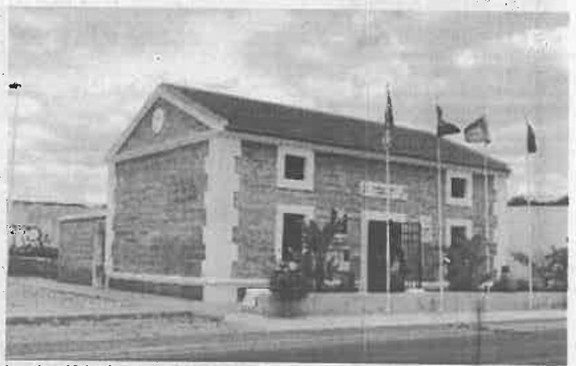
La antigua Oficina de Turismo del Alto de la Casilla que acogerá la sede del GRO.

El alcalde remitió el pasado mayo un escrito a la Dirección General del Patrimonio del Estado explicando el interés del Ayuntamiento de poder disponer del uso de la casa de los peones camineros para utilizarla como oficinas, por lo que solicitaba