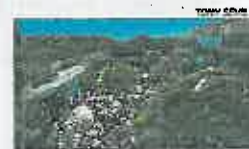
HASTA ARRIBA DE ESCOMBROS Abandono total ► Construcción abandonada repleta de escombros y basuras en el sector Montecarlo, con un tendido eléctrico desvendado y a escasos metros de las zonas residenciales.

Denuncia vecinal. Es una imagen tercermundista para un destino turístico residencial. Los vecinos de Aguas Nuevas han tenido que «sacar a pasear» mediáticamente a las culebras bastardas que viven a cuerpo de rey escondidas entre escombros, basuras donde proliferan sus principales presas, las ratas, para que alguien les haga caso.