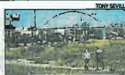
CAMINOS DE TIERRA La principal avenida, sin acera ► Este es el camino de tierra que hay que atravesar para llegar al Colegio Virgen del Carmen, IES Libertas y el supermercado, porque la Avenida Cortes Valencianas no tiene acera.