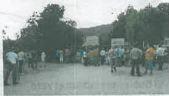
Concentración a las puertas de la planta en La Murada.

actuando en los vasos 1 y 2 y sellando el 3, la construcción de una balsa de 52.000 metros cúbicos y dotando de bombas hidráulicas para la conducción de los lixivios», problema que insistieron es el más preocupante ya que han detectado que en otra finca cercana amarillean los árboles por los vertidos enterrados bajo ellas. También dieron cuenta de que por parte de Valencia se tiene prevista una balsa similar y que el juicio por los enterramientos ilegales no tardará en salir. Asimismo repasaron la situación del vertedero de Campoamor y el logro de conseguir que el Plan Zonal no contemplase una planta en Cox y el vertedero en Albaterra.