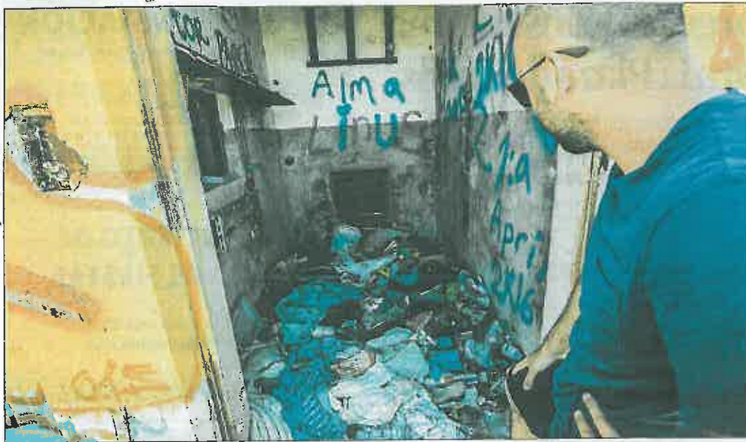
Interior de una torre eléctrica abandonada en el sector Montecarlo, a escasos metros de las casas de Aguas Nuevas. TONY SEVILLA