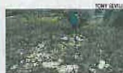
JUNTO A LAS CASAS Sanitarios, televisores... ► Aspecto que presenta el transformador de Aguas Nuevas junto a unos de sus accesos a la Avenida de las Cortes Valencianas. Hay sanitarios, televisores y todo tipo de residuos.