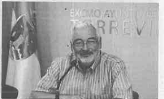
El primer edil en su comparecencia tras la Junta de Gobierno.

El alcalde reconoció que existe un informe en contra del departamento de Intervención que advierte de una posible ilegalidad y de que no hay retención de crédito, por lo que ha sido necesario levantar el re-