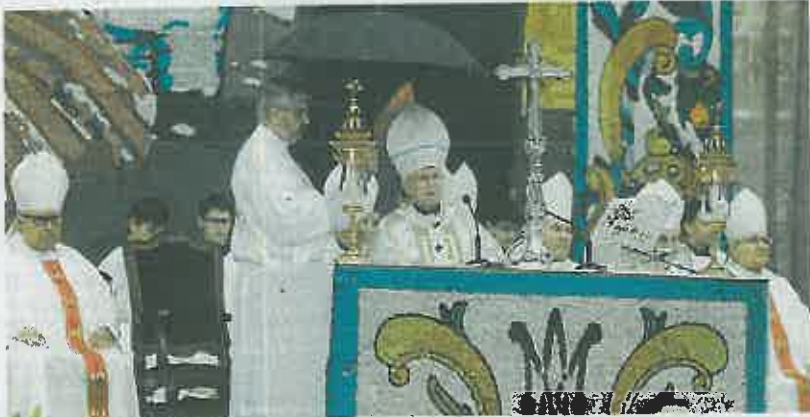
Cañizares durante la homilía en la misa de la Virgen de los Desamparados.