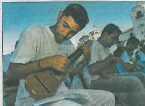
Concentración de timpleros canarios en 2006.

EL JUEZ ACUSA A LOS IMPUTADOS DE COMPRAR EL TIMPLE «CON ABSOLUTA DESPREOCUPACIÓN DE SU VALOR REAL»