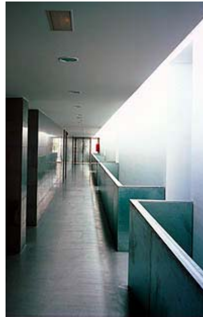
"Puig Campana" School . Finestrat